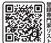
登録専門家リスト